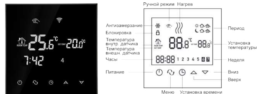
Рисунок 1. Термостат TGT70